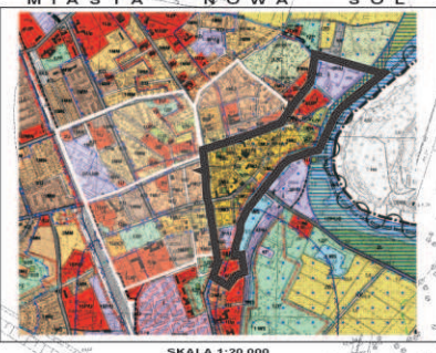
SKALA 1:20 000

OPRACOWAŁ: mgr inż. arch. DOROTA FRYNDT - HALABURDZIN mgr inż. arch. PAWEŁ HALABURDZIN mgr inż. arch. ZYGUNT STACHOWSKI mgr inż. JERZY SOBKOŃSKI mgr inż. JERZY KACZKOWSKI mgr inż. MAREK GIBOWSKI